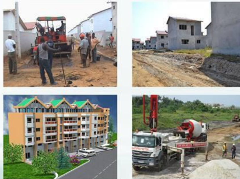
Tableau des offres à LCIM